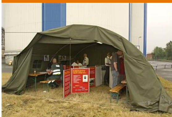
CoPI oefenweek 2008

10, 11, 12, 15 en 16 juni 2009 CoPI oefenweek